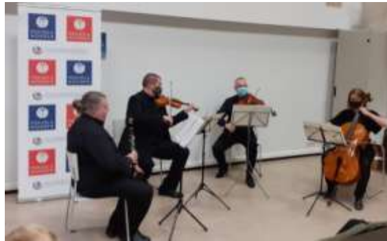
Kymi Sinfonietta, kvartetti

Tilaisuuteen oli yleisöllä vapaa pääsy (rajoitettu määrä).