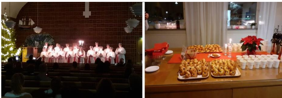
Luciavesper 13.12. Langinkosken kirkossa

Tilaisuus jäi taloudellisesti yhdistyksen varoista maksettavaksi sen jälkeen, kun Lucia-neitoa ja kuoroa oli muistettu pienin tukistipendein. Hallitus päätti kuitenkin lahjoittaa yhdistyksen varoista seurakunnan diakoniatyölle, kotkalaisten lasten joulun tukemiseen 320 € summan, joka saatiin ohjelmien myynnistä. Yhdistyksen katettavia kuluja syntyi lisäksi myös painokuluista ja lehti-ilmoituksesta. Tavoitteena on jatkossa päästä nollatulokseen.